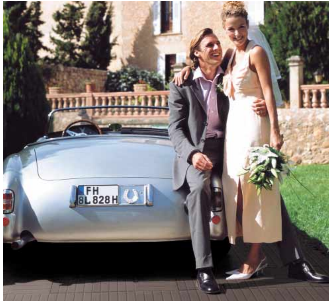
●リーネア ●ブルーノブラウン

BANCHINA 塗装仕上コンクリート製品・メタリックコンクリート製品 受注生産(納期:3週間程度)