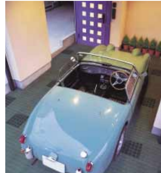
●グラータ ●レステブルー ●メタリック

車にとって大敵な湿気、粉塵、油汚れから愛車を守るバンキーナ。ガレージ専用開発された高性能舗装材です。