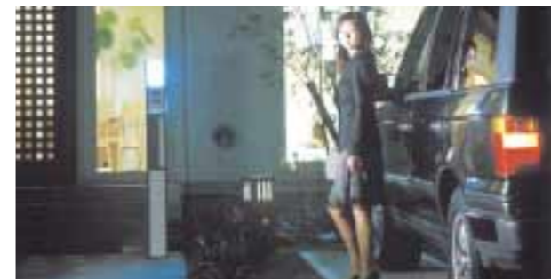
●カノーア ●ヴァーノ ●スタンド付

SECURITY LAMP LIGHT SPIA コンクリート製品 意匠登録済み