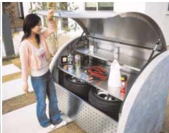
※1 ダンパー付きで蓋の開閉も容易です。カバーにはロック(鍵)が付いて安心です。 ※1

豊かなガレージライフを実現するため、シャープで高品位なデザインのタイヤ収納シェルフを開発しました。大容量の収納力をはじめ、ライト、コンセント、ベンチレーションなど、ガレージライフを満喫出来る機能が盛り込まれています。