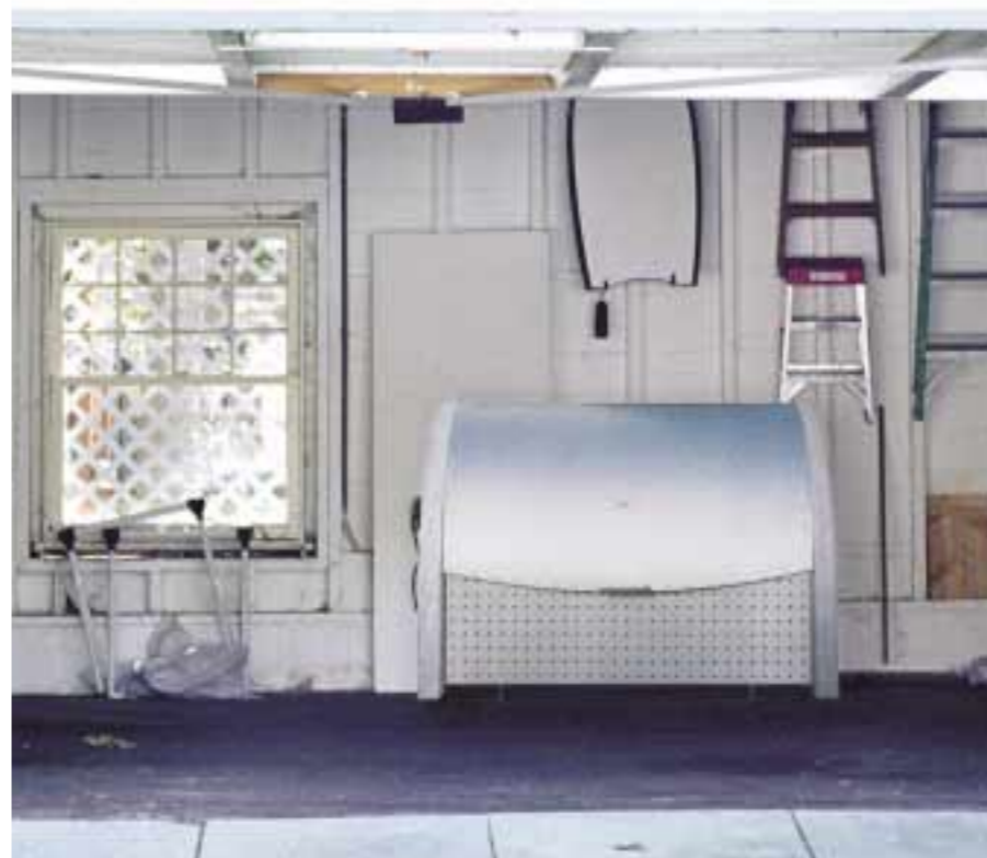
シャープでスッキリした外觀 ※1.シェルフ(棚)は別売品です。 ※2.収納可能なタイヤサイズは1本=φ700×H250以内です。

豊かなガレージライフを実現するため、シャープで高品位なデザインのタイヤ収納シェルフを開発しました。大容量の収納力をはじめ、ライト、コンセント、ベンチレーションなど、ガレージライフを満喫出来る機能が盛り込まれています。