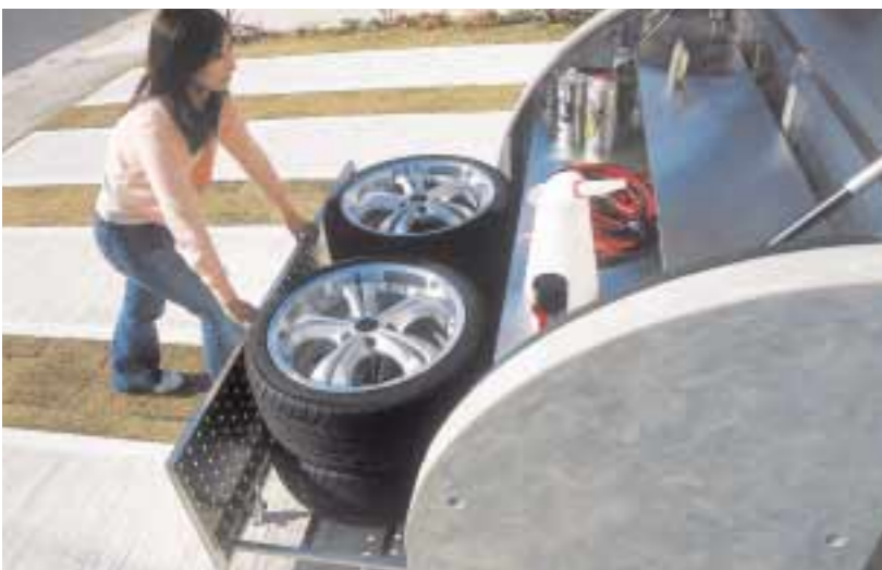
タイヤの収納もラクラク