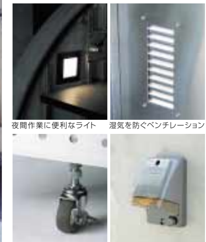
夜間作業に便利なライト 湿気を防ぐベンチレーション

タイヤの保管方法 タイヤにとって紫外線・オゾン・油は大敵です。ガレージシェルフに保管することで、タイヤの劣化を防ぐことが出来ます。またタイヤをホイールとセットで保管する場合は、空気圧をやや落とし平積みする事が原則です。