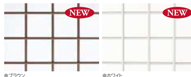
●ブラウン ●ホワイト