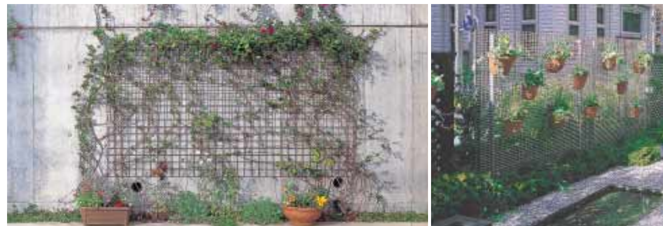
ブラウンフェンス ■直付けフェンス ●ブラウン

丸みを帯びた優しい印象の固定金具で仕上がりに差がでます。球面デザインの固定金具は線材と同色にし美しく仕上げています。